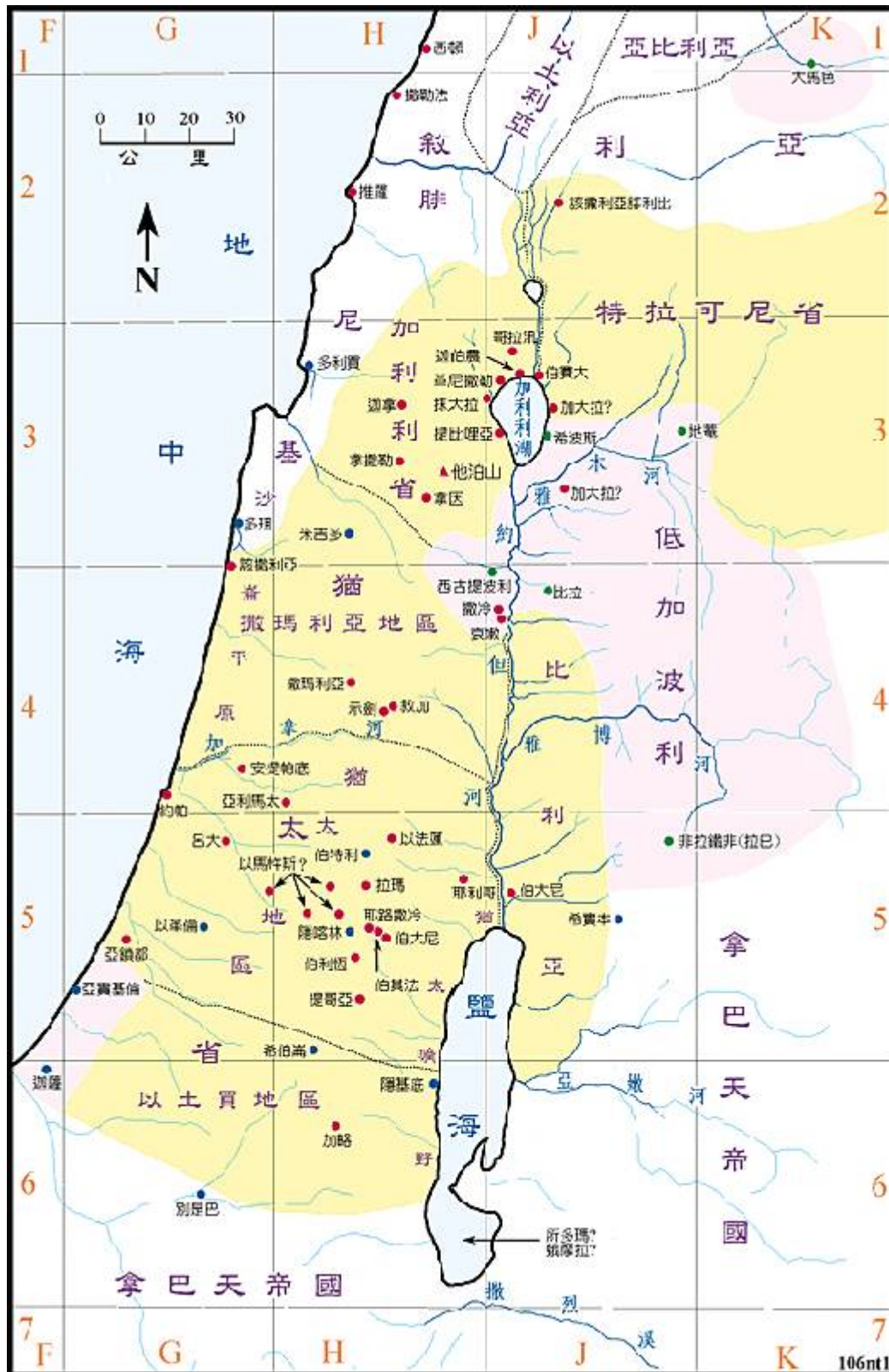
主前四年到主后三十年间的巴勒斯坦